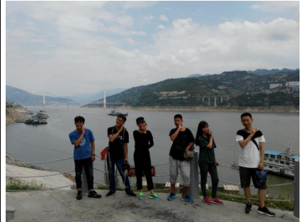
奉節古城江河風貌

晚上聚會話題是風景與故事，談這一路所見的風景、個人的感受、人文風貌，以及如何在旅程中探尋一座城市的秘密等。