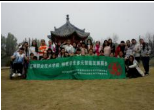
20161204 幸福場・陪伴成長活動